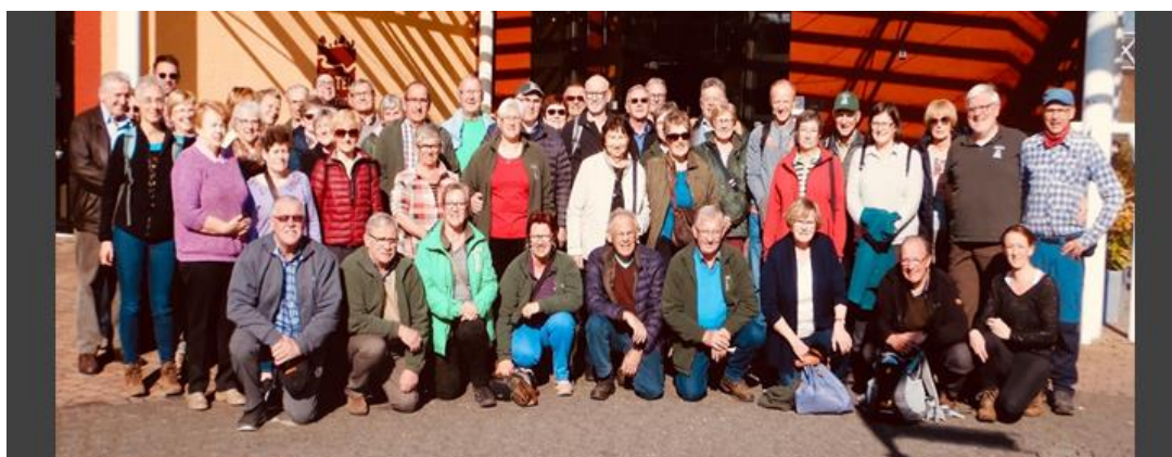
48 Vreugdestappers waagden zich aan de uitstap naar het Eifelgebied